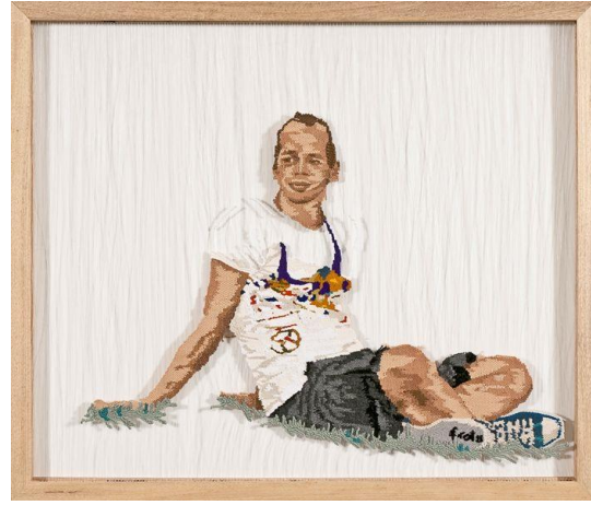
Görsel 3. Fırat Neziroğlu, Ergen/Mevsim Rüzgârları, 2011, Yün İpliği Dokuma ve Misina, 100x100 cm.