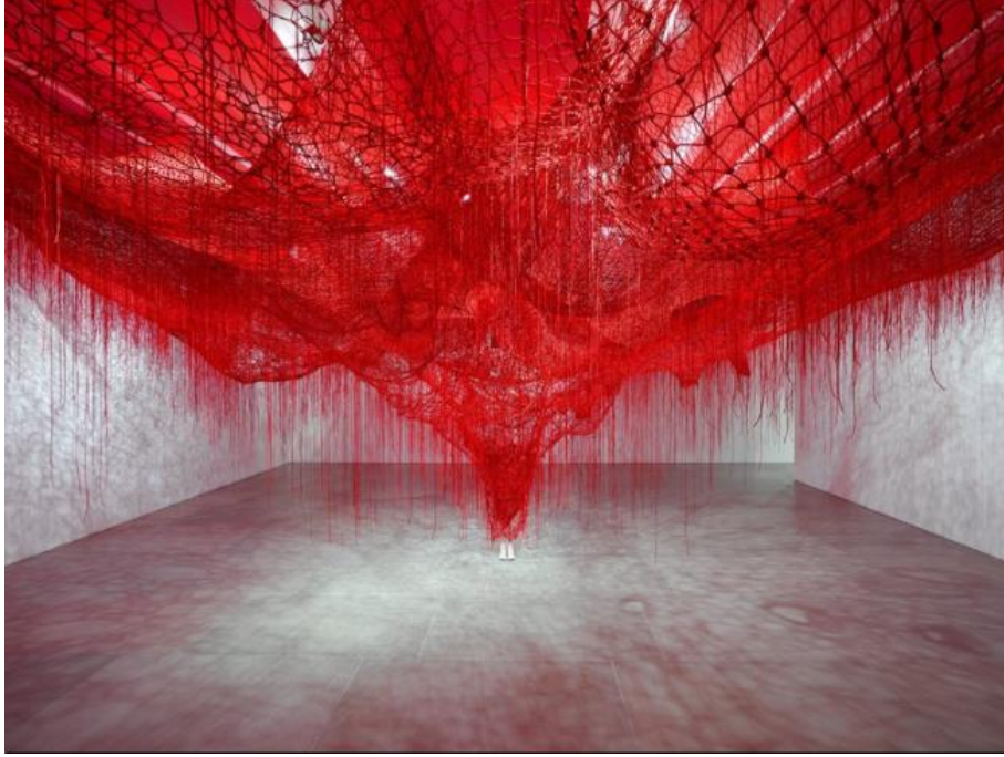
Görsel 7. Chiharu Shiota, Ben Başka Bir Yerde (Me Somewhere Else), 2018, Kırmızı Yün, İp, Alçı

Vücudumun evrene bağlı olduğunu hissediyorum, fakat bu benim bilincimde mi?" diyor Shiota, "Ayaklarım dünyaya dokunduğunda, dünyaya insan bağlantılarının bir ağı gibi yayılan evrene bağlı hissediyorum ama eğer vücudumu artık hissetmiyorsam nereye giderim? Vücudum gittiğinde nereye giderim? Ayaklarım artık yere değmediğinde (ajournal.blog, 2018b).