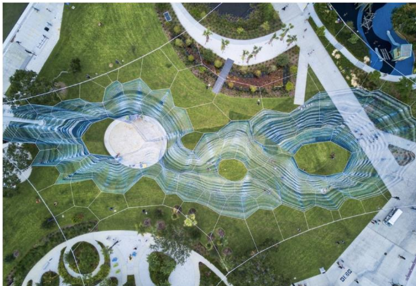
Görsel 2. Janet Echelman, Bükme Arkı (Bending Arc), 2020, Petersburg.

Amerikalı heykeltıraş ve lif sanatçısı Janet Echelman, mekâna özgü tasarladığı enstalasyonları ile tanınmaktadır. Çoğu kamusal alanda sergilenen çalışmaları boyutları ve tasarımlarıyla etkileyicidir. Küçüklüğünde tarihi kartpostallarda gördüğü mavi ve beyaz plaj şemsiyelerinden ilham alarak oluşturduğu Bükme Arkı (Bending Arc) çalışması açık alanda bile oran-orantı bağlamında boyutsal olarak dikkat çekicidir. Bükme Arkı, 1.662.528 deniz mili ve 180 mil ipten oluşan dalgalı bir hava heykelidir. Heykel rüzgârda dans ederken, parkın karşısına şekiller ve gölgeler oluşturarak ziyaretçilerini kucaklamaktadır. Geceleri, eflatun ve mor ışıkla aydınlatılması onun daha büyüğü algılanmasını sağlar (Stewart, 2020).