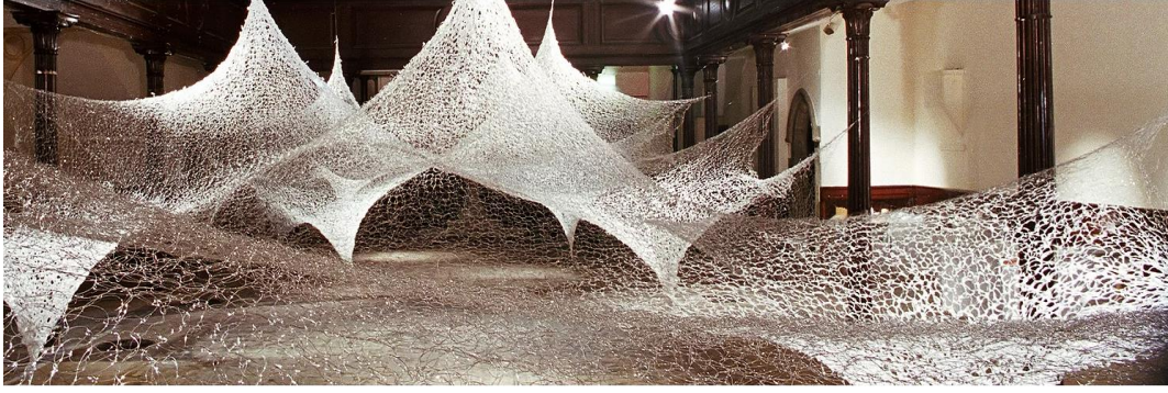
Görsel 5. Machiko Agano, Textural Space, 2003, Enstalasyon, Paslanmaz Çelik, El Yapımı Kağıt, Poliamid ve İpek İplik.

Machiko Agano üretimleri hakkında; “Biz Japonlar bazen doğada gizemli, görünmez bir güç olduğunu söylüyoruz. Bunun öyle olduğunu hissediyorum, bu görünmez, her şeyi kuşatan gücü çalışmalarım aracılığıyla göstermeye çalışıyorum. İzleyicinin işimi gördüklerinde doğanın gizemleri tarafından kuşatılmış hissetmesini isterim” ifadesi ile ilişkisel bir yaklaşımı da desteklemektedir (Fabrica.org.uk, 2001). Büyüleyici bir görünüme sahip olan enstalasyon havada asılı duran ağ dokularını anımsatır. Narin, kırılabilir, hafif ve esnek görünümünün altında kapsayıcı ve kuşatıcı bir role bürünür gibidir. Sanatçı çalışmasıyla bir taraftan mekâna müdahale ederken bir taraftan da izleyicinin klasik eser inceleme anlayışını da sarsar. Enstalasyonlarında genellikle tavandan sarkıtılan parçalarının saydamlığı aracılığıyla çevrenin renklerinden yararlanmaktadır. Sanatçının enstalasyonlarında büyük ölçüde nötr veya berrak renkler hakimdir (fibrenell.blogspot.com,2010).