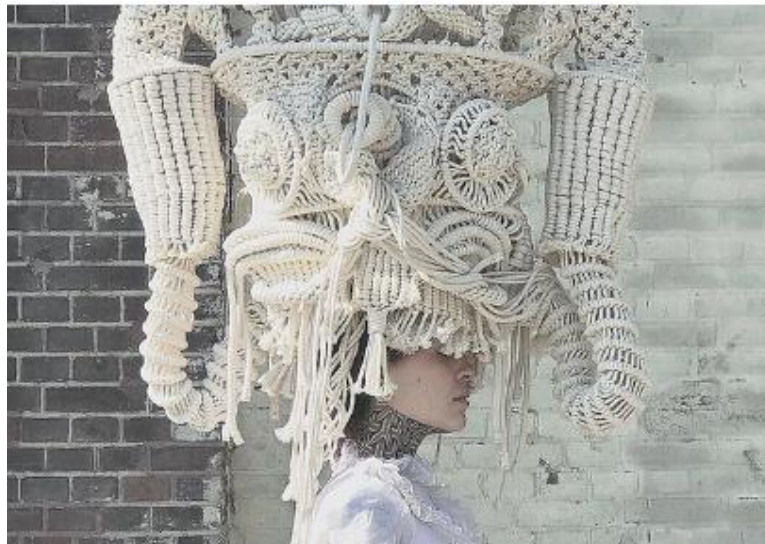
Görsel 6. Sandra de Groot, Giyilebilir Heykeller, 2019

Çağdaş sanat anlayışı ile birlikte yeni ifade olanaklarını ve sorgulamaları da içinde barındıran çağdaş heykel sanatının oluşturduğu plastik dil yeni ifade olanakları ve alternatif malzeme kullanımı ile çeşitlenerek tekrar tekrar yenilenmektedir (Özkul, 2019:74). Bu açıdan değerlendirildiğinde, sanatçı Sandra de Groot ana malzemesi ip olan bir örgü üretimi olan makrome tekniği ile giyilebilir heykeller tasarlamaktadır. Sanatçı koleksiyonundaki beyaz makrome heykeller ile zanaat ve tekniği, mimari ve kültürel yollarla araştırıyor. Tekstil formlarını oluşturan halatların her biri, doğal yapılarını ve şekillerini korumalarını sağlayan yüksek kaliteli pamuktan üretiliyor ve her heykel elle düğümleniyor. Sanatçının amacı ortaya çıkan giyilebilir heykeller ile arkasında yatan yoğun üretim süreci hakkındaki farkındalığı arttırmaktır (Mert, 2020). Sık atılan düğümlerin bir araya gelmesiyle yoğun ve zahmetli bir süreci somutlaştıran sanatçı, izleyiciyi genel kullanım alanından farklı olan malzeme/teknik bileşenlerini aykırı bir alanda kullanımı aracılığı ile izleyiciyi bilindik kalıpların dışına çıkarmaktadır.