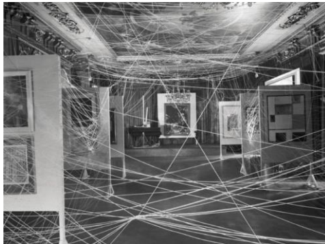
Görsel 1. Marcel Duchamp, 16 Miles Of String, 1942, Enstalasyon, New York.

Günümüzde lif sanatında, değişik malzemeler, el işi ve makina teknikleri kullanılarak, üç boyutlu yada enstalasyon grubuna girmiş ve kavramlaşmış sanatsal eserler üretilmektedir. Konu olarak sosyal, felsefe ile ilgili sorunlar seçilmektedir (Sakalauskaite, 2011:38). 1950'li yıllardan sonra gelişen tekstil teknolojileri alanın yaygınlaşmasına ve lif sanatı olarak sanat dünyasına girmesine olanak sağlamıştır. Yeni sentetikler, yapıtların plastik değerlerinde yeni algılamalara yol açmış, dijital baskı gibi yeni teknolojiler lif sanatı da dâhil olmak üzere birçok sanat disiplini tarafından kullanılmaya ve disiplinlerarasında ortak bir zemin oluşturmaya başlamıştır (Özpinar, 2009: 23). Gündelik yaşamda, kumaşları dikmek, nesnelere bir araya getirmek, paketlemek, asmak, sabitlemek amacıyla kullanılan iplikler, yüzyıllar boyunca çeşitli anlamlar yüklenmiştir. Kavramsal sanat anlayışıyla birlikte alışılmış tekniklerin ve malzemelerin dışına çıkan sanatçılar, eserlerinde birçok farklı malzemeyle birlikte iplikleri de kullanmışlardır (Özkendirici, 2018:208).